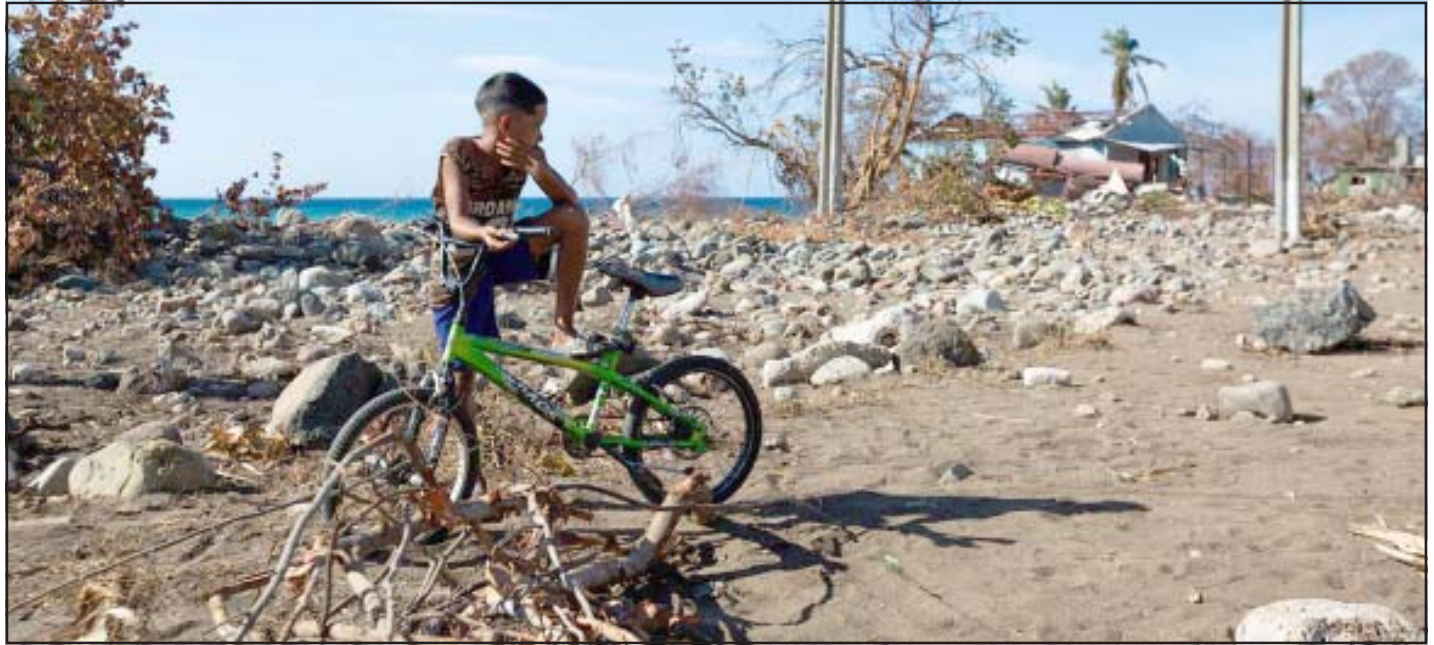
Un niño pequeño se sienta en una bicicleta verde entre los escombros y los restos en Guamá, Santiago de Cuba, tras la destrucción generalizada causada por el huracán Melissa (foto de archivo).

El coordinador residente de la ONU en Cuba, Francisco Pichón, advirtió este lunes sobre el deterioro de la situación humanitaria en el país, agravada por la crisis energética y que se suma a los efectos del huracán Melissa. La escasez de combustible ha empeorado después de que Washington haya bloqueado a finales de enero la entrada de suministros de petróleo en la nación caribeña. A pesar de la llegada de suministros limitados de combustible, incluido un reciente cargamento de petróleo enviado por Rusia al que Estados Unidos permitió atracar la semana pasada a pesar del bloqueo, "las necesidades humanitarias en el país siguen siendo muy acuciantes y persistentes", afirmó Pichón. El sistema de Naciones Unidas, junto a la Oficina de Coordinación de Asuntos Humanitarios, ha lanzado un plan de acción revisado que prioriza el acceso a energía como eje central de la respuesta. El plan busca asistir a unos dos millones de personas en 63 municipios de ocho provincias, frente al millón contemplado inicialmente. "La crisis energética está teniendo un impacto humanitario sistémico y cada vez ma-